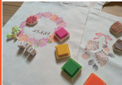
▲秋のはんこで作るエコバッグ