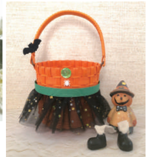
▲ドレスバスケット