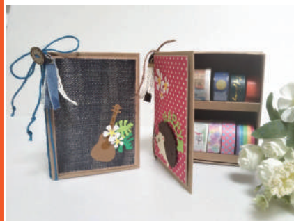
▲Book型マステボックス（2個セット）