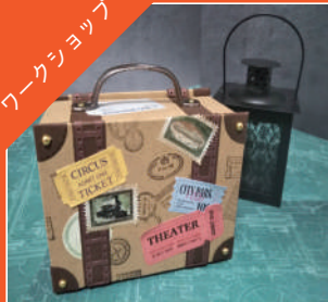
▲トランク型トレジャーBOX