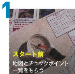
1 スタート前 地図とチェックポイント 一覧をもらう

親子や友達などでチームを組んで挑戦！ 子供から大人まで楽しみながら、 地域のスポット(チェックポイント)を 巡るゲーム感覚のスポーツです。