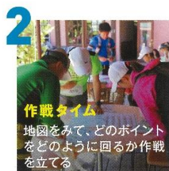
2 作戦タイム 地図をみて、どのポイント をどのように回るか作戦 を立てる