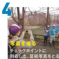
4 写真を撮る チェックポイントに 到着した、証拠写真をとる