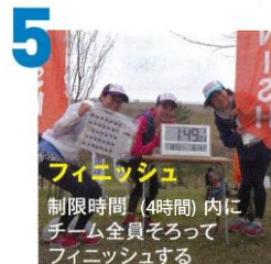
5 フィニッシュ 制限時間 (4時間) 内に チーム全員そろって フィニッシュする