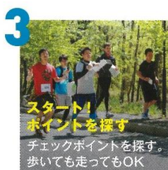
3 スタート! ポイントを探す チェックポイントを探す。 歩いて走ってもOK