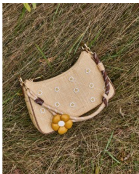
Philomena フィロメナラフィア フラワークロスボディーバッグ / 13,900円