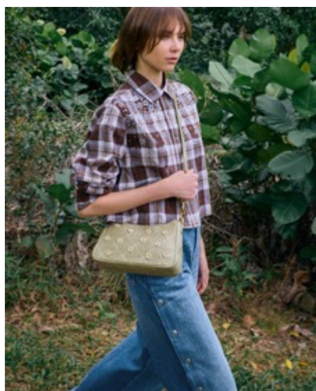
Philomena フィロメナラフィア フラワークロスボディーバッグ / 13,900円