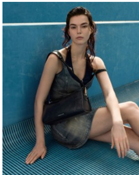
Delfina デルフィナ イロンゲイト ショルダーバッグ / 13,900 円