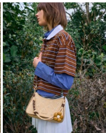
Philomena フィロメナラフィア フラワークロスボディーバッグ / 13,900円