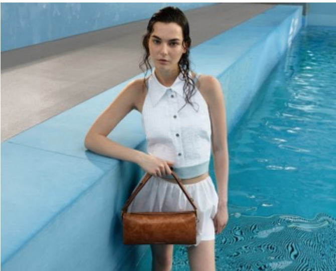
Delfina デルフィナ イロンゲイト ショルダーバッグ / 13,900 円