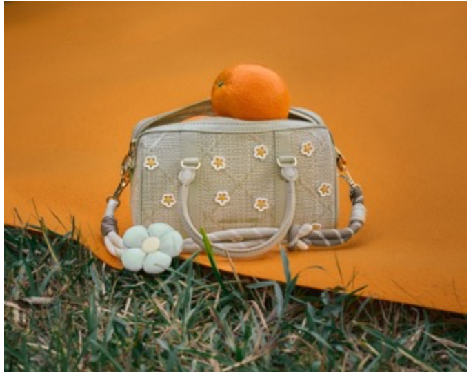
Philomena フィロメナ ラフィア フラワーボウリングバッグ / 13,900 円