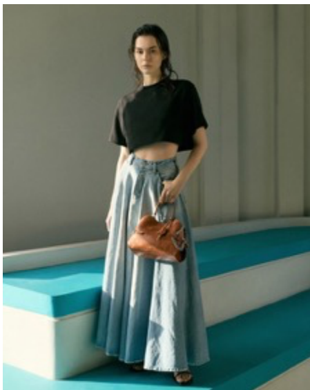
Delfina デルフィナ チェーン サイドベルト トートバッグ / 16,900 円