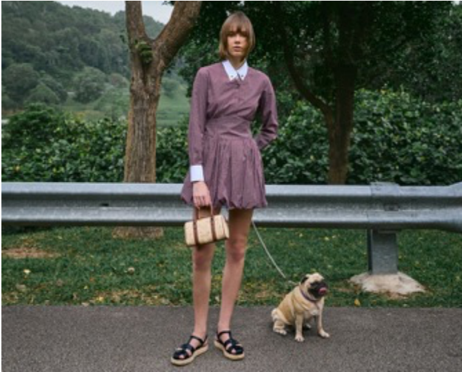
Philomena フィロメナ ラフィア フラワーボウリングバッグ / 13,900 円