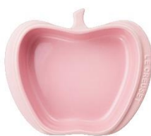
ミニ・アップル・ディッシュ