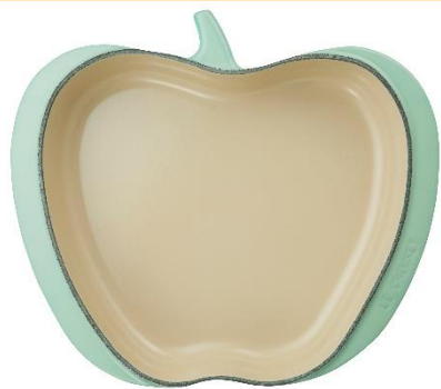
アップル・ディッシュ