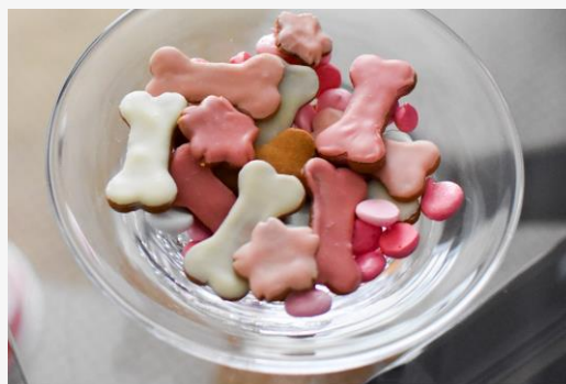
アイボカリカリクッキーとメレンゲミックス