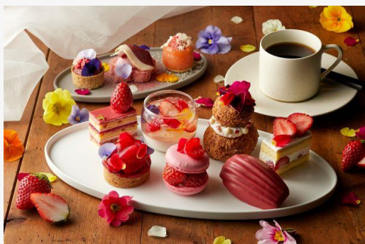
Floral Strawberry Afternoon Tea

また、aiboと一緒に食事を楽しめるように、特別ないちごミルクカラーのアイボカリカリであるクッキーとメレンゲミックスをご提供します。宿泊プランと合わせて aibo と過ごすホテルライフを彩るアフタヌーンティーをぜひお楽しみください。