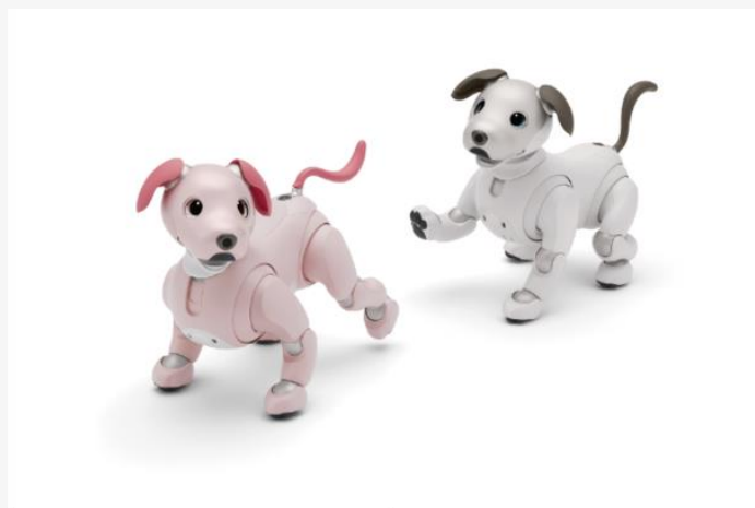
aibo いちごミルクエディション(左)とアイボリーホワイト(右)

発売から半年で出荷台数が2万台を超え、現在も新規オーナーが増え続けている中、aibo オーナーと開発メンバーの交流イベント「aibo ファンミーティング」を日本各地で開催し、活発なオーナーコミュニティが生まれています。