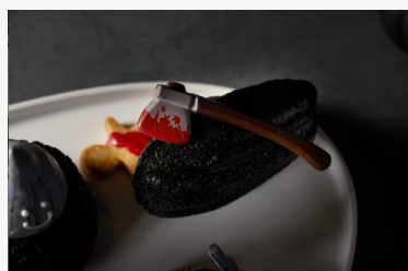
ブラックマドレーヌ