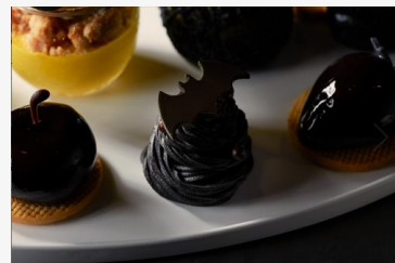
コウモリモンブラン