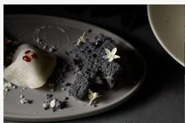
十字架トリュフサンド