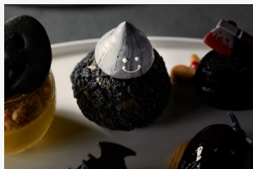
真っ黒おばけシュークリーム