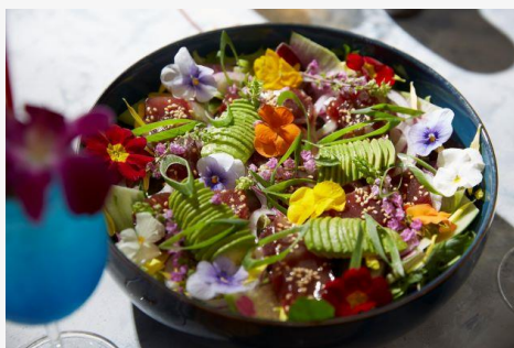
マグロとアボカドのポキサラダ

なかなか海外に行けない今、ご家族やご友人、職場の方々と銀座でハワイ気分を楽しんで、次のハワイ旅行を企画してみませんか？