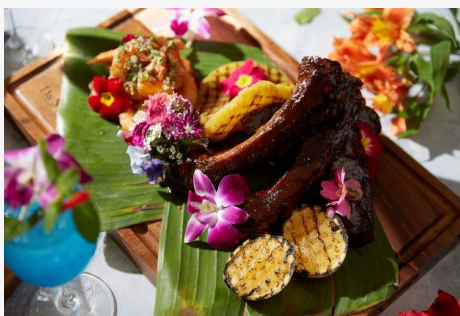
国産豚スペアリブのオープン焼き Tokyo バーベキューソース スパイス風味のパイナップルグリル