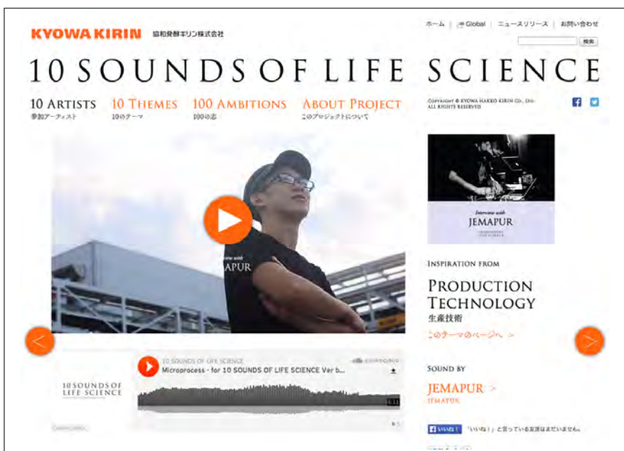
「10 ARTISTS」：新曲の視聴・ダウンロード、インタビュー映像をご覧いただけます。

インタビューから導きだされたJEMAPURの「10の言葉」を公開します。 気に入った言葉をクリックするとSNSでシェアいただけます。