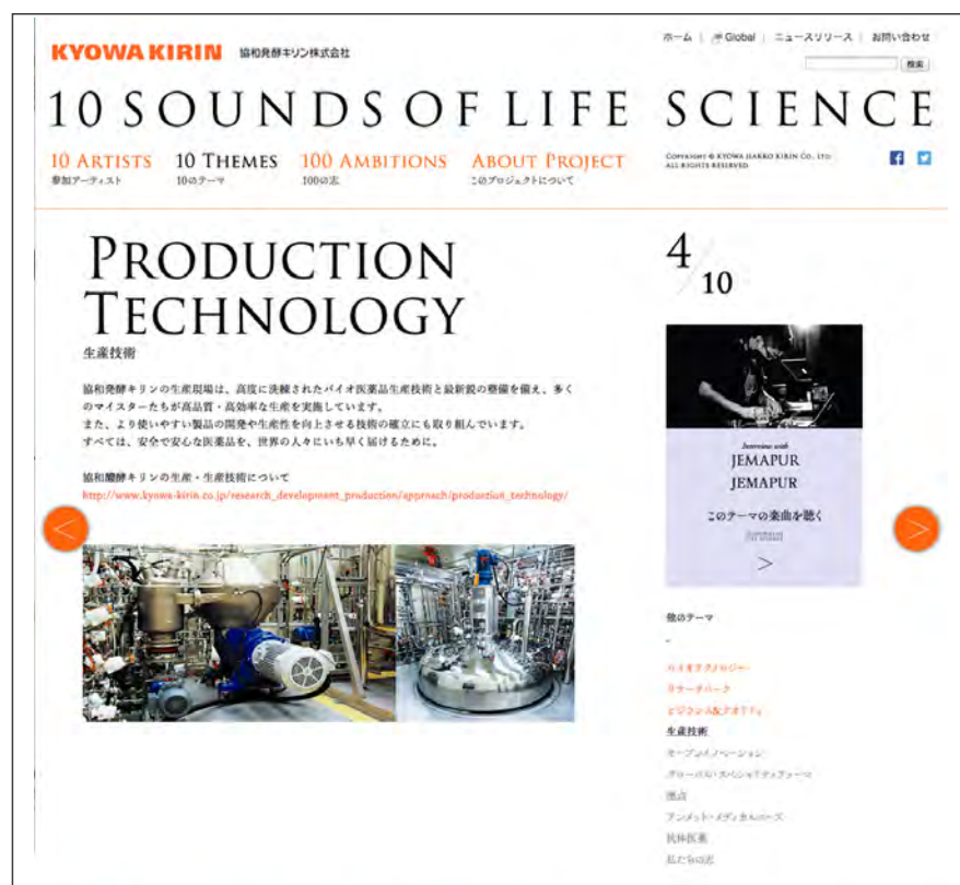
「10 THEMES」：各テーマの詳細をご紹介します。