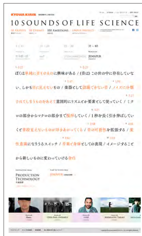
「100 AMBITIONS」：JEMAPURの10の言葉をお楽しみいただけます。