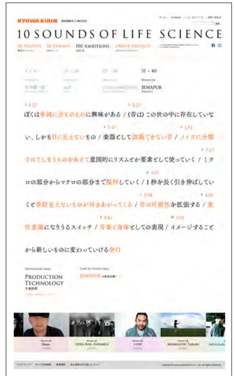
「100 AMBITIONS」：DJ KAWASAKI氏の10の言葉をお楽しみいただけます。