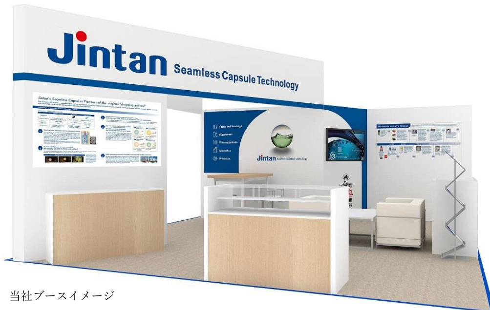
当社ブースイメージ

今回のブースでは、多くの知見と豊富な実績を持つ当社のシームレスカプセル技術について展示を行い、その多様性と汎用性を幅広く情報発信いたします。