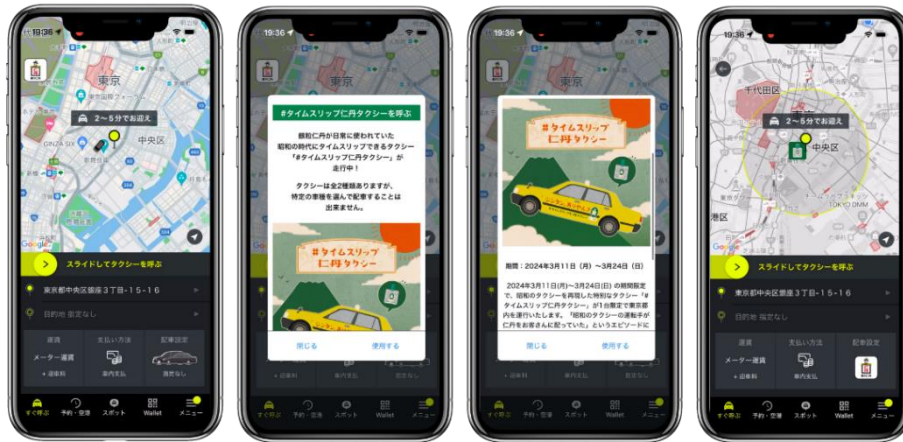
アプリ画面イメージ

タクシーアプリ「S.RIDE」を起動し、画面左上に表示されている『#タイムスリップ仁丹タクシー』のアイコンをタップし、「使用する」を選択することで配車可能。※タクシーはフルラッピング車両とCanvas車両の2種類ありますが、特定の車種を選んで配車することは出来ません。