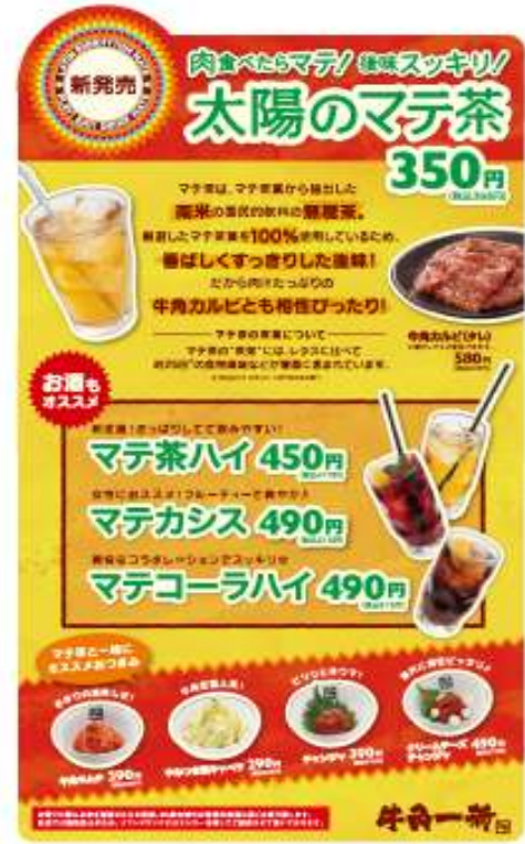
「牛角」差し込みメニュー展開イメージ