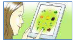
<背景パネル 生成イメージ例>