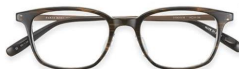
PARIS MIKI Authentic Eyewear 006~007

フロントアセテートは日本製の生地でチョイス。上質なツヤ感は職人による手磨きがあつてこそ。