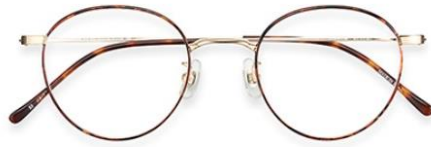
波瑠さん着用モデル