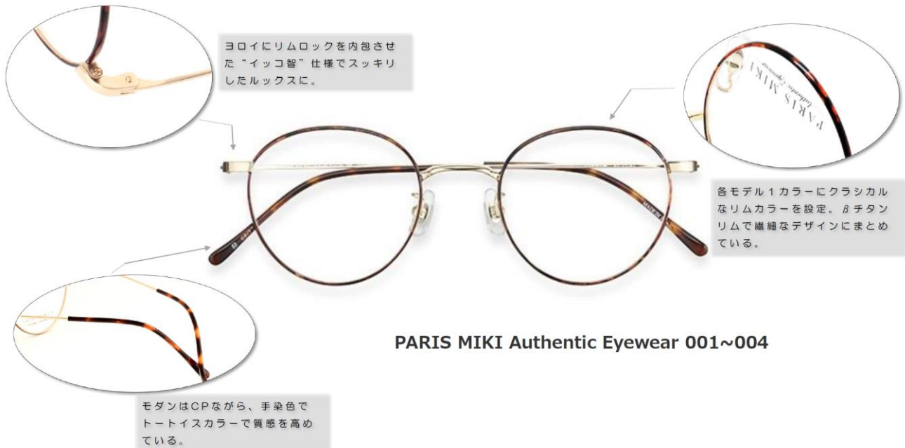
PARIS MIKI Authentic Eyewear 001~004