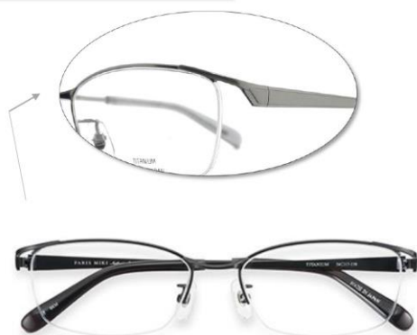
PARIS MIKI Authentic Eyewear 005

オールチタン製のビジネスライクなデザイン。日本製メタルフレームらしい質感の高い仕上がり。