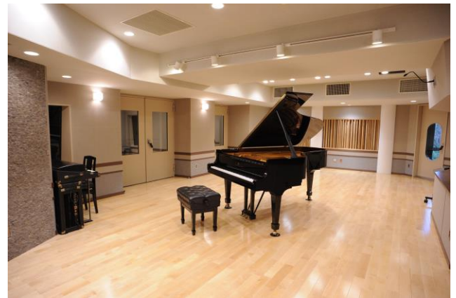
USEN White Studio