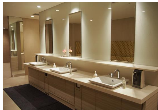
各階パウダールームおよびレストスペース