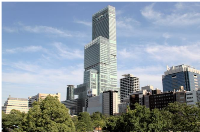
あべのハルカス外観

また、対象者を大阪府下の学生に限定し、一次の書類審査通過者に関しては、2013 年 10 月 26 日（土曜日）に、USEN White Studio にて、選定オーディションを開催します。