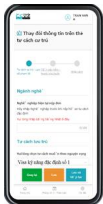
【外国人専用入力フォーム】

特定技能に特化した『とくマネ』は、登録支援機関、外国人、受入機関、各々にアカウントを発行し、それぞれの情報を一元化。登録支援機関、外国人、受入機関、それぞれが質問に答えていくだけで申請書類へ自動入力されます。一括修正機能や複製機能などの補助機能も充実しているため、円滑かつ迅速な書類作成業務を可能にするだけでなく、書類作成漏れや記載ミスも防ぐことができます。10カ国語の翻訳機能が搭載されているので、外国人は母国語で迷わず入力でき、各種申請帳票の出力も容易になります。