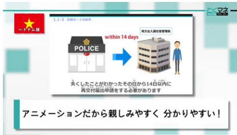
【ネイティブナレーション※による生活オリエンテーション動画】