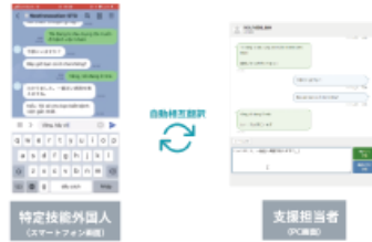
【自動相互翻訳チャット機能による相談窓口】