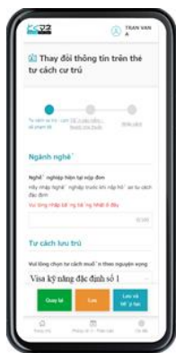
【外国人専用入力フォーム】

特定技能に特化した『とくマネ』は、登録支援機関、外国人、受入機関、各々にアカウントを発行し、それぞれの情報を一元化。各々が『とくマネ』に設定された質問に答えていくだけで申請書類へ自動入力されます。一括修正機能や複製機能などの補助機能も充実しているため、円滑かつ迅速な書類作成業務を可能にするだけでなく、書類作成漏れや記載ミスも防ぐことができます。10カ国語の翻訳機能が搭載されているので、外国人は母国語で迷わず入力でき、各種申請帳票の出力が容易です。