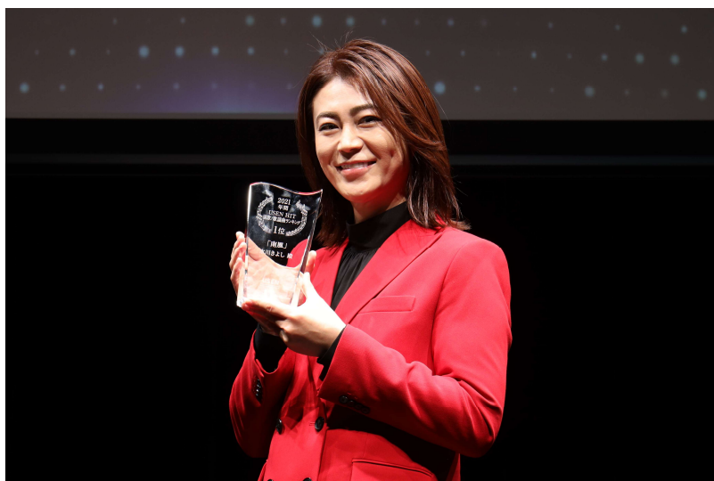
2021 年間 USEN HIT 演歌/歌謡曲ランキング 1 位 氷川きよし「南風」

演歌/歌謡曲ランキング 1 位は、氷川きよし「南風」。受賞にあたり「多くの方の真心でリクエストをいただいた結果なので、みなさまに差し上げたい賞です。自身の新たな決意を歌った『南風』という楽曲での受賞にすごく意味があると感じています。」と笑顔で語りました。またデビュー 22 年目を迎え、「芸能生活 22 年で最も充実した一年でした。これまでずっと前だけを見て駆け抜けてきたが、今年は歌詞を書くなど作品づくりに力を注ぎ、自身の心を見つめながらじっくりと考える時間を持つことができました。」と今年を振り返りました。