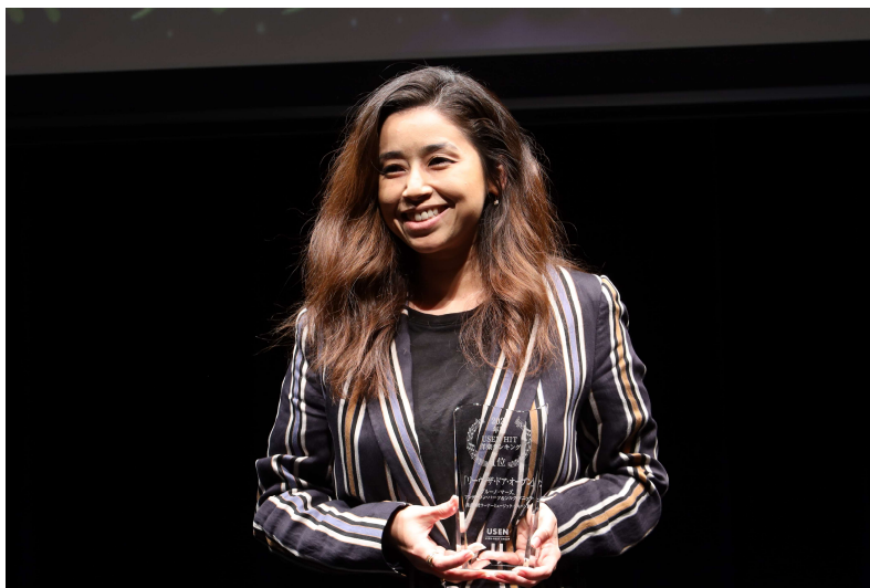
2021 年間 USEN HIT 洋楽ランキング 1 位 Bruno Mars, Anderson .Paak, Silk Sonic 「Leave The Door Open」代理

なお洋楽ランキング 1 位は、「Bruno Mars, Anderson .Paak, Silk Sonic（ブルーノ・マーズ、アンダーソン・パーク&シルク・ソニック）」の「Leave The Door Open（リーヴ・ザ・ドア・オープン）」でした。ビッグ・アーティスト同士の夢のようなコラボレーションに期待が高まるなかリリースされたソウルフルなシングルが、堂々の 1 位を獲得しました。