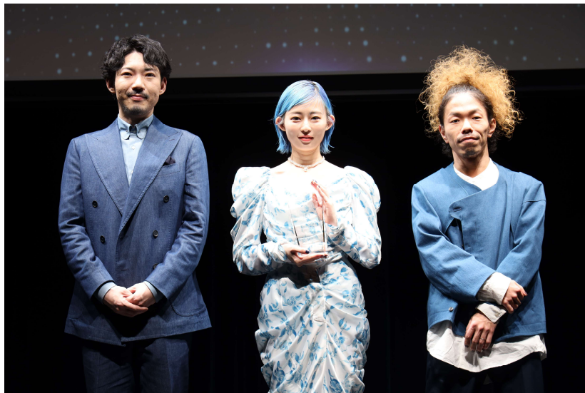
2021 年間 USEN HIT J-POP ランキング 1 位 Awesome City Club 「勿忘」

今年公開の映画主題歌としても話題の「勿忘」で J-POP ランキング 1 位となった Awesome City Club は、「幼い頃から身近な存在で、世代を問わずに聴かれている USEN のランキングで受賞できたことを嬉しく思います。」とコメント。また「今年には『勿忘』の楽曲を通して多くの方に知っていただけた年でした。来年はもっと知ってもらい愛していただけの年にしたいです。」と今後の抱負を語りました。