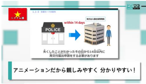
【10 国語ナレーションによる生活オエンテーション動画】