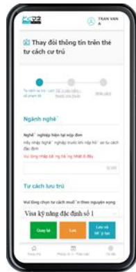
【外国人専用入力フォーム】

特定技能に特化した『とくマネ』は、登録支援機関、外国人、受入機関、各々にアカウントを発行し、それぞれの情報を一元化。登録支援機関、外国人、受入機関、それぞれが質問に答えていくだけで申請書類へ自動入力されます。一括修正機能や複製機能などの補助機能も充実しているため、円滑かつ迅速な書類作成業務を可能にするだけでなく、書類作成漏れや記載ミスも防ぐことができます。10カ国語の翻訳機能が搭載されているので、外国人は母国語で迷わず入力でき、各種申請帳票の出力も容易になります。