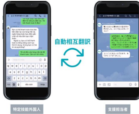
【自動相互翻訳チャット機能による相談窓口】