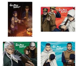
△クリアファイル(4種)