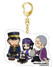
△アクリルキーホルダー 杉元&アシ(リ)パ&白石