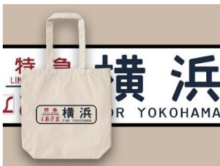
キャンパストートバッグ (M)