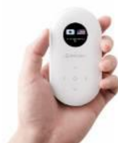
「POCKETALK(ポケットーク)」 初代モデル