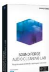
「SOUND FORGE Audio Cleaning Lab」