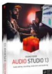
「SOUND FORGE Audio Studio 13」

さらに、発売を記念し、本日より5月6日(月)までの期間、「SOUND FORGE」、「VEGAS」シリーズなどを最大割引率90%で提供する「The Chance GOLD」キャンペーンを実施します。