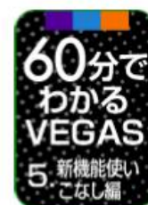
「60分でわかる VEGAS 5.新機能使いこなし編」