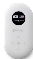
「POCKETALK(ポケットーク)」 初代モデル

「POCKETALK(ポケットーク) W」は初代モデルと比べ、本体サイズはそのままに画面は3倍以上大きくなり、タッチパネルを採用。世界105の国と地域で使えるグローバル通信機能を内蔵しているため (注3) 面倒な設定は不要ですぐに使えます。通信は4Gに対応し、翻訳速度も向上、見やすさ、使いやすさ共に刷新しました。言語数はインド英語やオーストラリア英語などのアクセントにも対応し74言語 (注4) に拡大、翻訳精度の向上も実現しています。