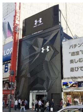
UNDER ARMOUR CLUBHOUSE 渋谷