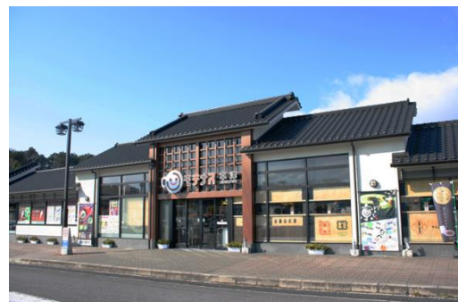
草津パーキングエリア(上り線)