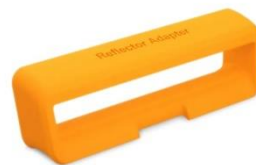
「Osmo(オズモ) リフレクター for iPad」 1,500円(税込)