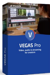
「VEGAS Pro 20」 39,800円