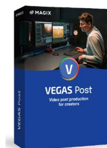
「VEGAS Post 20」 59,800円