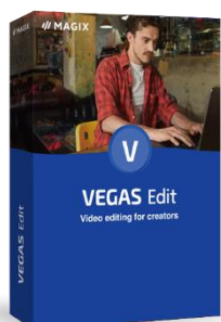
「VEGAS Edit 20」 15,400円

また発売を記念し、本日より9月28日(水)までの間、弊社サイトでは本シリーズを最大78%割引で提供するキャンペーン「The Chance VEGAS Pro」を実施いたします。