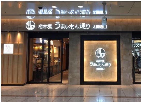
名古屋うまいもん通り