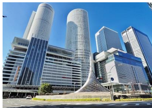
ジェイアール名古屋タカシマヤ