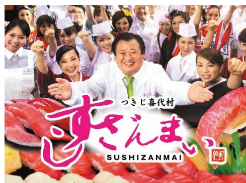
すしざんまい 本店