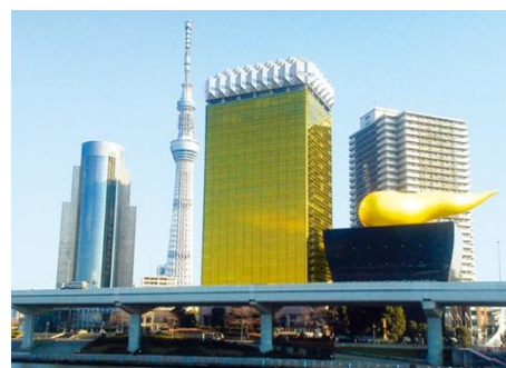
展望ラウンジ アサヒスカイルーム