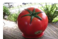
『やさいインスタ映え科』