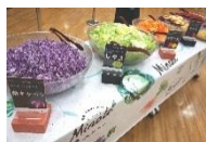
『やさい味わい学科』