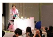
『やさいサイエンス学科』