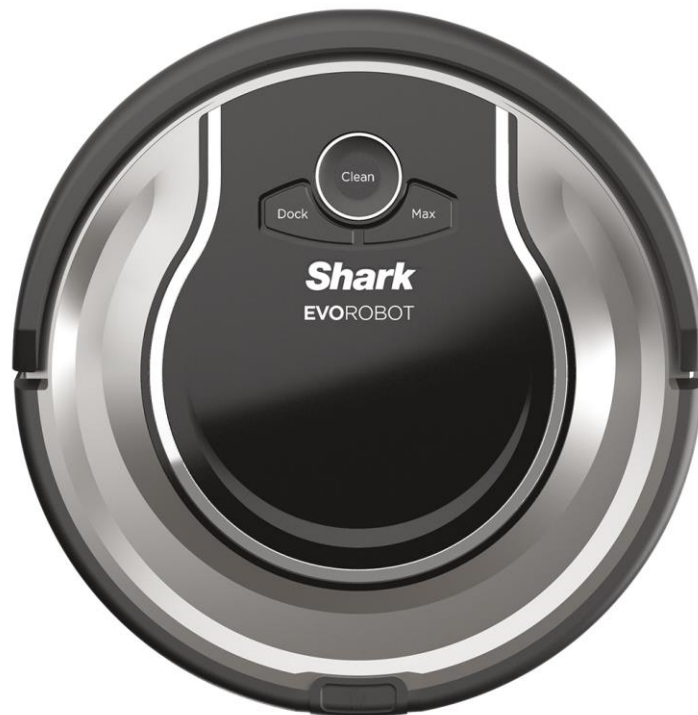
Shark EVOROBOT R72

Shark EVOROBOTはShark公式オンラインストアでお買い求めいただけます。