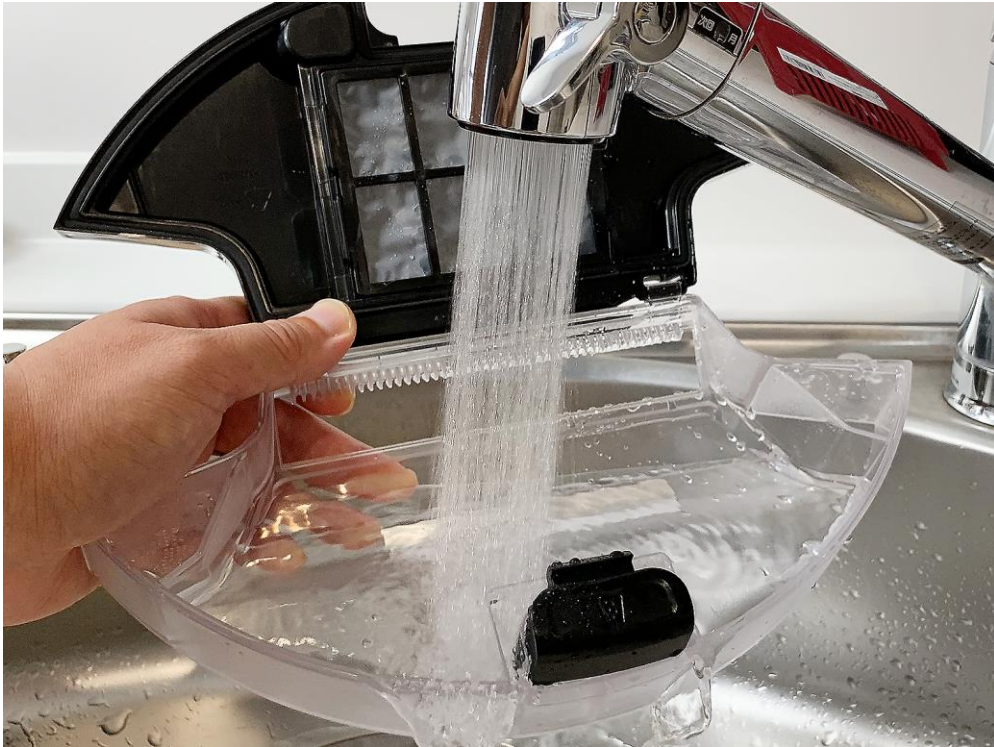
水洗いのできるダストカップ