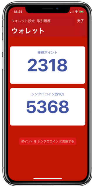
暗号通貨ウォレット