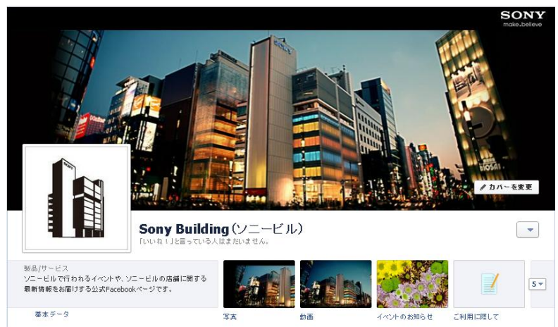
【ソニービル Facebook トップページ】

今回の公式 Facebook ページのオープンに合わせて、昨年カンヌ国際広告祭での受賞が記憶にも新しい、映像作家/アートディレクター菱川勢一氏が監督をした、ソニービルのイントロダクションムービーを初公開。“A DAY”というタイトルの通り、ある日のソニービルの1日を切りとり、待ち合わせや買い物、イベントなどで訪れ、行き交う人々と、ソニービルとの時間の関わりを、美しい映像と音楽で表現しています。