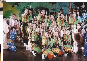
日本舞踊 福島里の子会→