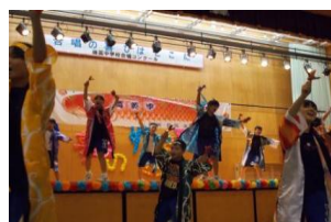
←新地町 子供よさこいクラブ