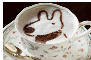
リサのホットチョコレート

・提供時間：11:00～22:30 (17:00～は別途サービス料10%を頂戴します)