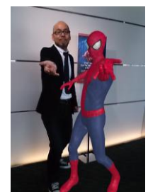
5つのミッションをクリアすると撮れる “3D SNAP”写真の一例