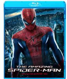
『アメーキング・スパイダーマン』 Blu-ray: ¥2,381+税 好評発売中 発売・販売元:ソニー・ピクチャーズ エンタテインメント