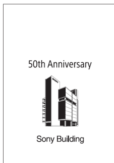
5 ポイント クリアファイル(A4 サイズ)