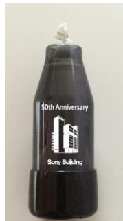
15 ポイント 修正テープ