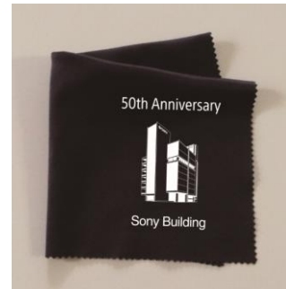
25 ポイント クリーナークロス