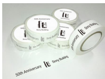
50 ポイント マスキングテープ