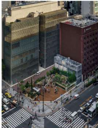
Ginza Sony Park 2018.8 - 2021.9