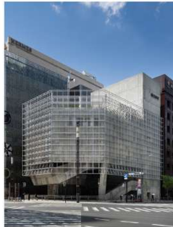
Ginza Sony Park 2025 -

Ginza Sony Park プロジェクトは、「街に開かれた施設」をコンセプトに 50 年以上にわたって銀座の街と歩んだソニービルを建て替えるプロジェクトです。