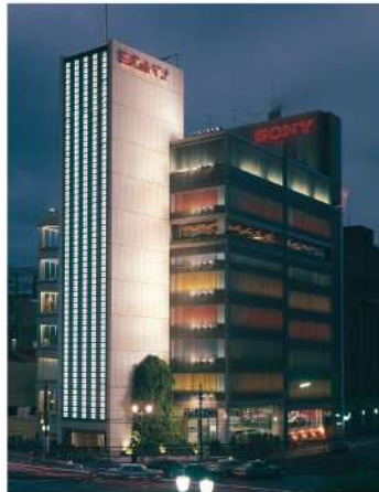
Sony Building 1966.4 - 2017.3