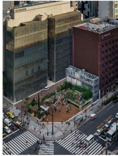
Ginza Sony Park