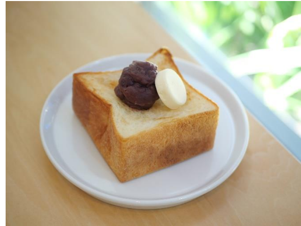
あんバタートーストセット ¥650 (税込み)

モーニング・ティータイムには鉄板フレンチトーストや、あんバタートーストもご用意しております。