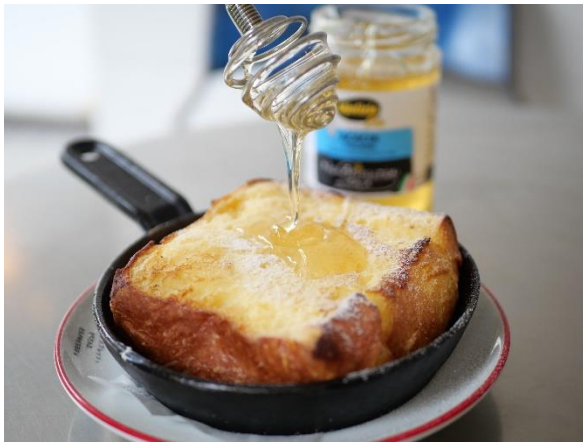
鉄板フレンチトースト ¥800 (税込み)