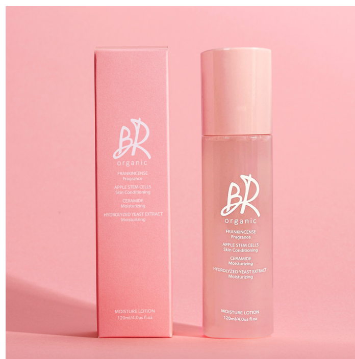
モイスチャーローション120ml 3月30日(水)発売