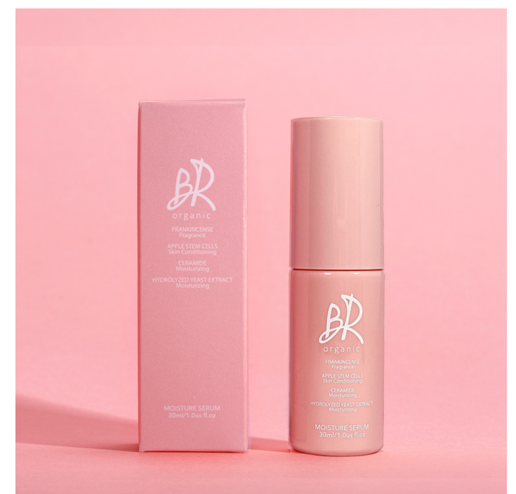
モイスチャーセラム 30ml 3月30日(水)発売