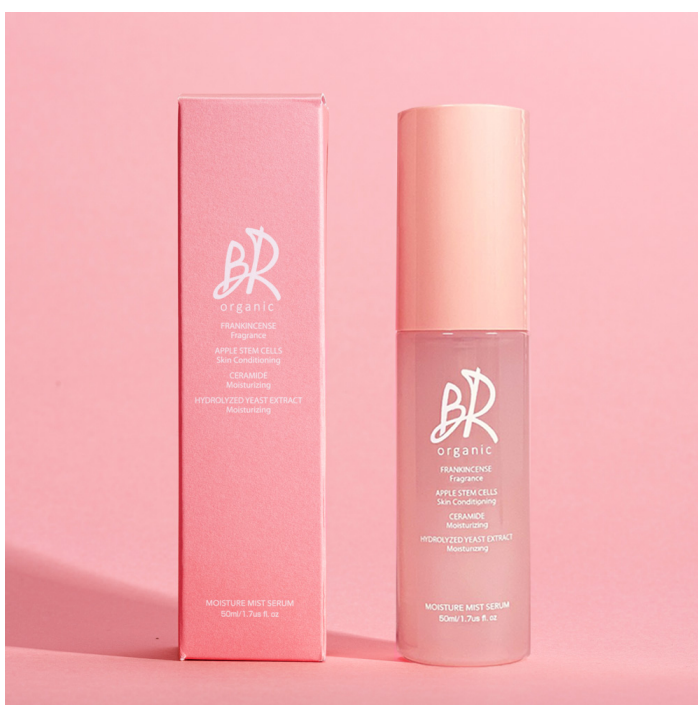
ミストセラム50ml 2月25日(木)発売

自社で「オーガニック基準」を定め、製品開発をすることで、お肌への優しさを第一に考えながらも14種類もの美容成分を贅沢に配合できる「BR オーガニック」は、確かなエイジング効果と使い心地の良さで、満足度の高いプロダクト作りを目指しています。