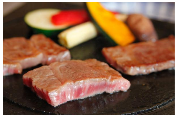
宮崎牛と地採れ野菜の鉄板焼き（イメージ）