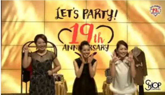
1日の売上が14億円を超え、過去最高記録を更新した2015年11月1日0時のオンエア オープニングの様子。