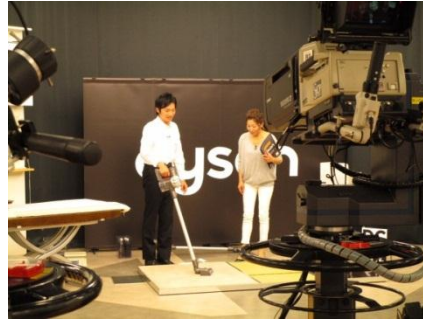
ダイソン掃除機の1日あたり1商品での販売額が約7.9億円を記録し、過去最高記録を約8年ぶりに更新した2016年4月21日のオンエア当日の様子（左）と、コールセンターの装飾（右）。