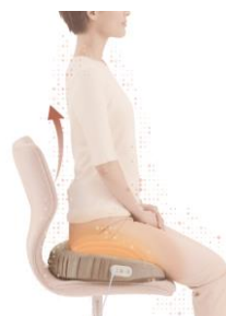
アテックスルルド暖クッション