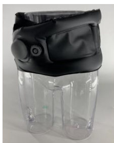
エアパッドサポーター（仮） 開発中のため、商品はイメージです。