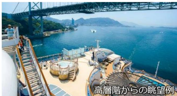
高層階からの眺望例