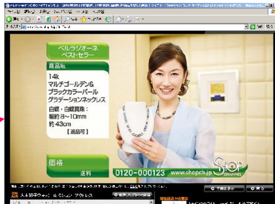
【高画質・大画面のストリーミング映像】