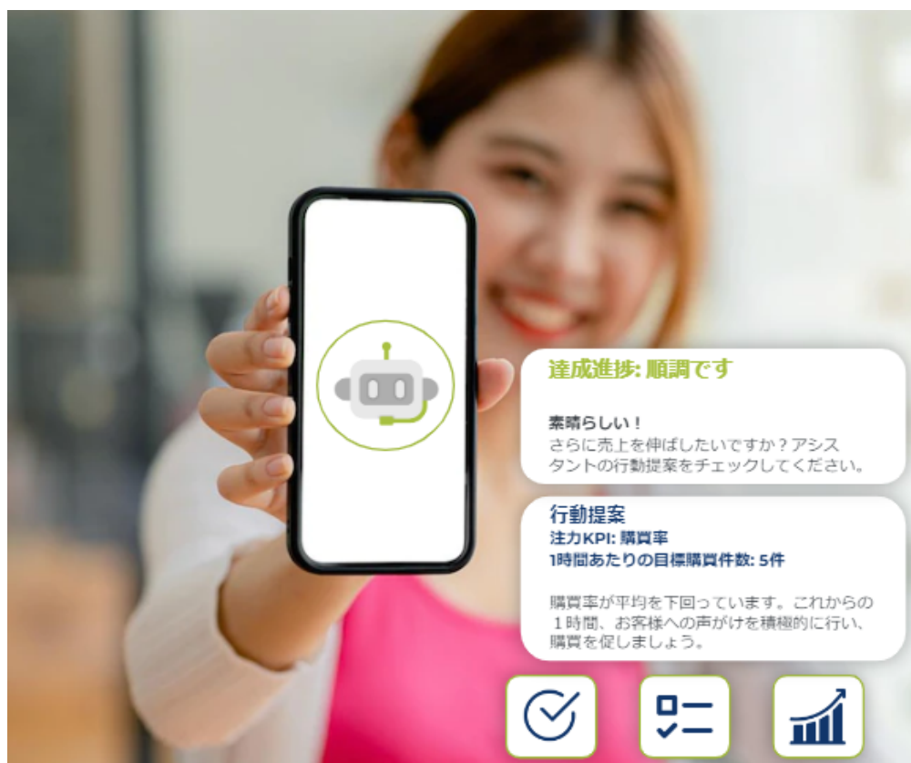
(Flow Assistantの行動提案イメージ)

配信する行動提案内容は、自由に設定できます(テンプレートも複数ご用意)。配信はチャットBOTを使って行われ、Flowのモバイル・アプリFlow for mobile *2 のチャット画面で受け取ることができます。企業の既存データや店舗業務システムと連携すれば、より多様な情報配信も可能です。